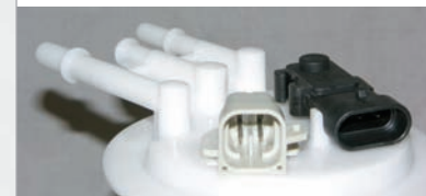
Módulo de Bomba de Combustible GM Con Conector de Arnés Viejo