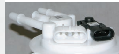
Módulo de Bomba de Combustible GM Con Conector de Arnés Nuevo