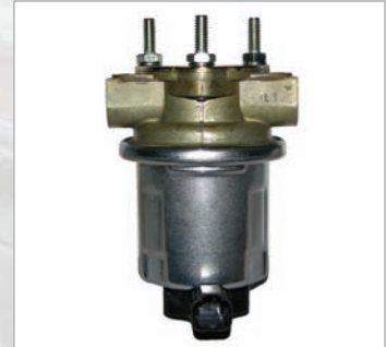
Bomba Existente en el Vehículo

Un proveedor de equipos originales reconocido para aplicaciones diesel robustas, Airtex ofrece al mercado décadas de experiencia de ingeniería, pruebas y aplicaciones del mundo real, con una solución de bombas de combustible diseñada para resistir las rigurosas exigencias de las aplicaciones de hoy en día.