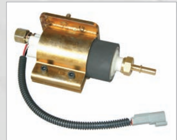
Diseño Mejorado Airtex (Con Arnés Dealambrado)